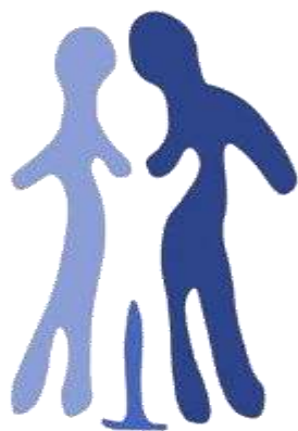
Association for Social Education